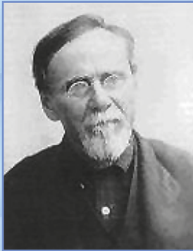
Dr. A. T. Still

L'Osteopata basa la propria valutazione sulle domande iniziali e sulle informazioni che riceve dal corpo, quali la postura globale, la qualità dei tessuti, la qualità ed estensione dei movimenti articolari, la tonicità neuro-muscolare, attraverso la sensibilità delle proprie mani.